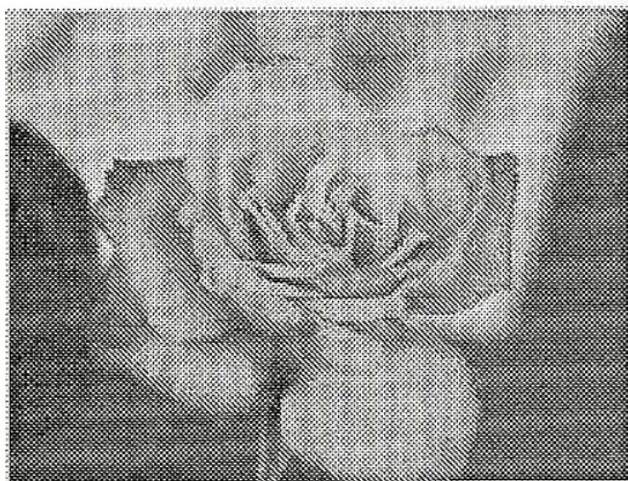
Die JCI verteilt Rosen.

Appenzell/AI. Am Freitag und Pfingstsamstag, 30. Mai 2009, waren Mitglieder der Junior Chamber Appenzellerland für Menschen unterwegs, die an MS erkrankt sind. - pd/MC